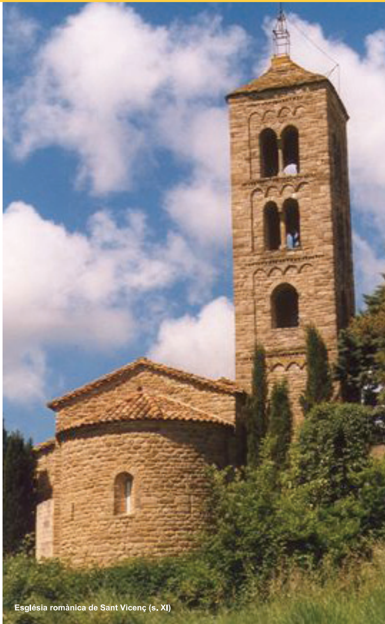
Església romànica de Sant Vicenç (s. XI)